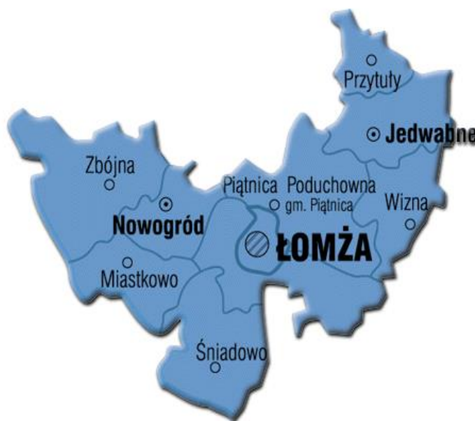
Rysunek 1. Położenie gminy Wizna w powiecie łomżyńskim.